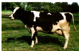
Рисунок 1 – Корова чёрно-пёстрой породы